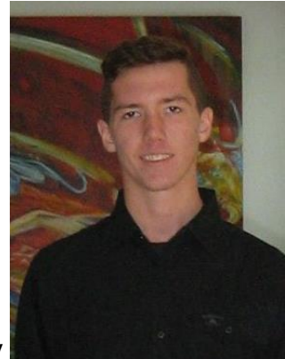
Prezident JA Firmy

Naša firma bola založená dňa 13.decembra 2015.